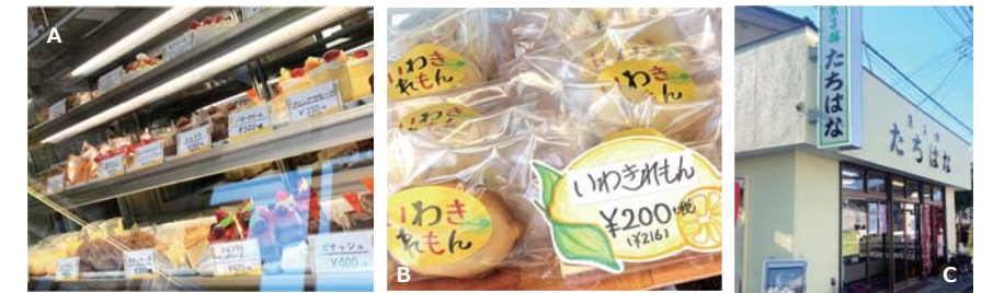
A:どれにしよう。ショーケースの中には美味しそうなケーキがたくさんで迷っちゃう！B:オススメの「いわきレモン」個包装なのでお土産にもぴったり。いわきのレモンの風味を味わってみて。C:お店は旧国道49号線沿いにあるので分かりやすく、壁面の塗装をしたので新しい外観となっています。

和菓子たちばなやさんも変わらずの人気で、昔からのお客様や常連さんなどが和菓子・洋菓子どちらも買い求めになる場合も多く、どちらも好きな方にとっては嬉しいお店です。